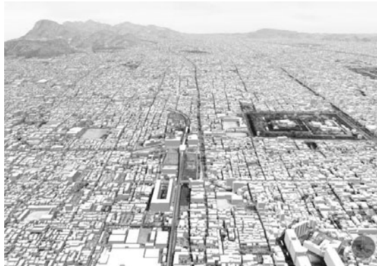
図1 京都の3D都市モデル