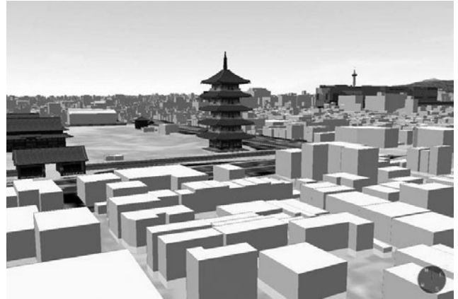
(b) 東寺周辺の浸水予想図